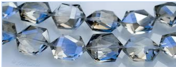
Kuva. Swarovski- tai Preciosa-kristallit sähdehtivät!

Tule mukaan koruiletaan torstaina 15.5. klo 17!